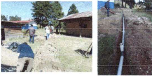
Foto1: REPARACION DE RED DE DRENAJE